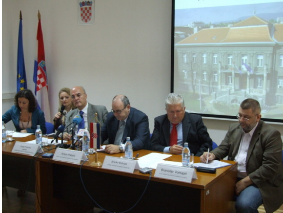
Tiskovna konferencija – Zagreb