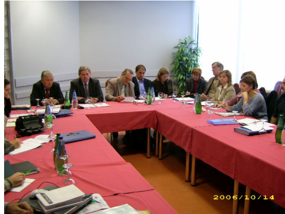
Radionica - Vukovar

Projekt je rezultirao izradom cjelovitog programa koji se sastoji od: