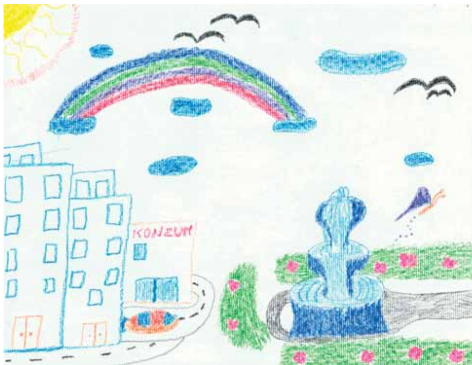
Gabi Mikelić, 4.b

Od 1998, Hrvatski zavod za zapošljavanje razvio je aktivne mjere zapošljavanja putem programa potpore zapošljavanju. Program je usredotočen na potrebe raznih nezaposlenih osoba, uključujući naučnike, branitelje, starije osobe i invalide.