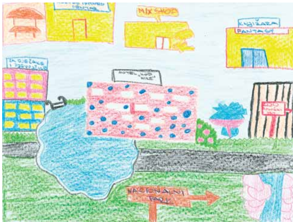
Andrea Bitunjac, 4.b

Domovinski rat (1991.-1995.) doveo je do depopulacije zaleđa županije, osobito područja koja su bila okupirana. Projekti obnove razorenih naselja odigrali su ključnu ulogu u povratku stanovništva. Na nacionalnoj razini u razdoblju 1995. – 2003. bilo je 315.102 povratnika, a u Zadarskoj županiji 37.325 povratnika, što čini oko 11%.