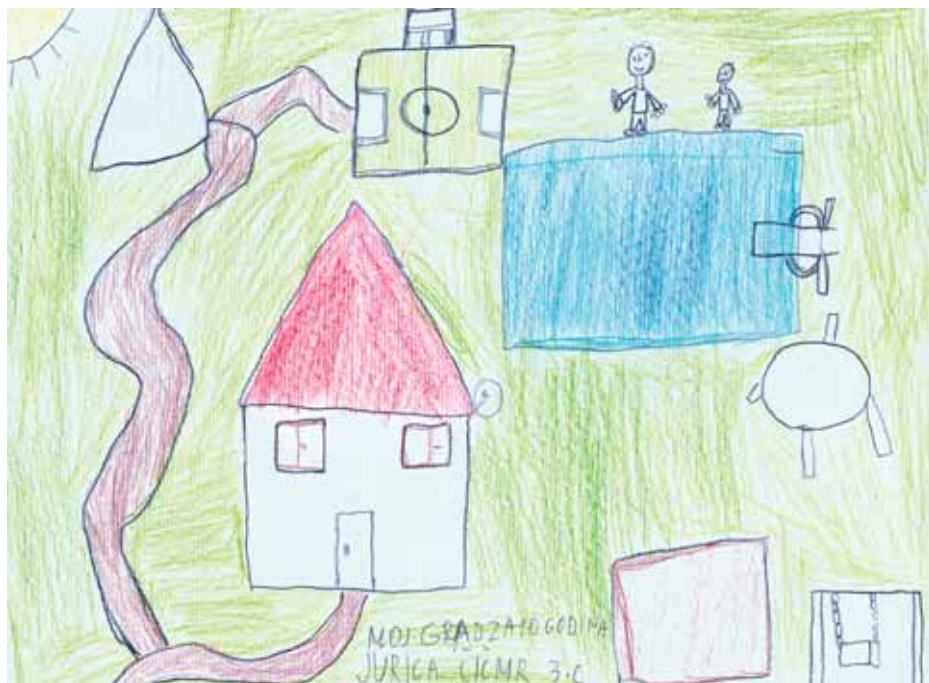
Jurica Čičimir, 3.c

Prema udjelu starosnih skupina najizrazitiji je trend starenja stanovništva, o čemu najbolje svjedoči podatak da je 2004. godine izjednačen udio mladoga (od 0 do 14 godina) i starog stanovništva (iznad 65 godina). U tom je pogledu Hrvatska slična većini europskih zemalja u kojima je udjel staroga stanovništva 16,5% (EU-25), odnosno 17% (EU-15).