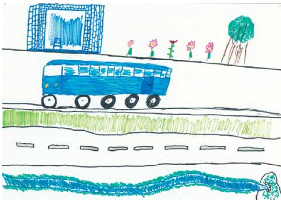
Mateo M., 3. b

Administrativna stopa nezaposlenosti Zadarske županije od 29,2% (RH 21,8%) u 2001.godini pala je na 21,1% (RH 18%) u 2004. godini. Kao što vidimo, ona je još uvijek veća od svoje vrijednosti za RH, međutim brzina pada administrativne stope nezaposlenosti je više nego dvostruko veća u Zadarskoj županiji.