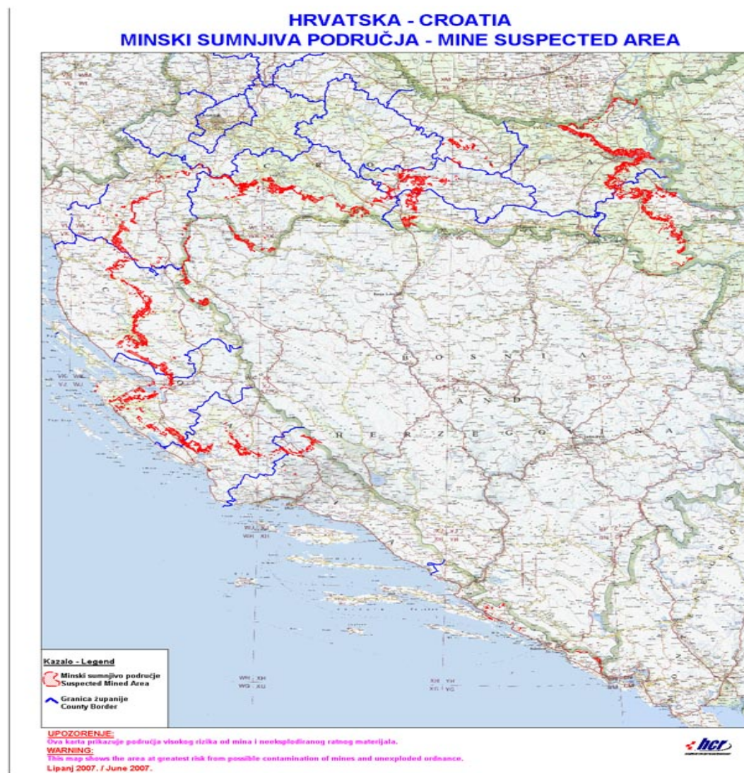
Slika 2: Minski sumnjiva područja u RH